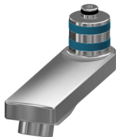
Schwenkauslauf, 100 mm